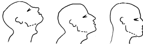
MOVIMENT DE CAP I COLL