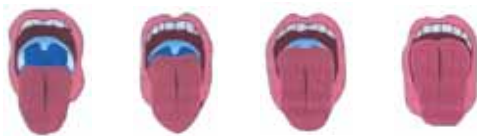
CLASSE DE MALLAMPATI-SAMSOON